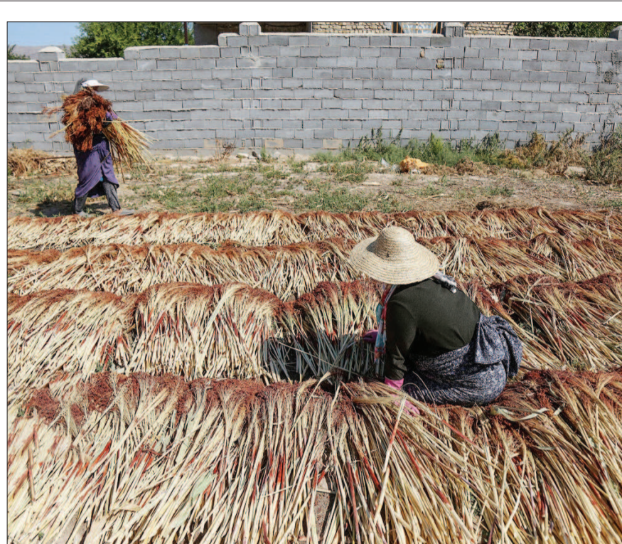
جاروبانی سنتی در خراسان شمالی

محققان یکی از شرکت‌های دانش‌بنیان با بومی‌سازی دانش فنی ساختن بویلرهای بازیافت حرارتی، علاوه بر کاربردی کردن آن در شیرین‌سازی نفت، اقدام به راه‌اندازی نیروگاه شیرین‌سازی آب دریا کردند که در حال حاضر این فناوری در قشم و بوشهر برای تامین آب شرب سالم به بهره‌برداری رسیده است. مدیر عامل این شرکت دانش‌بنیان طراحی و تولید انواع بویلرهای بخار و بازیافت حرارتی را از زمینه‌های کاری این شرکت دانش‌بنیان دانست و گفت: بیش از ۱۵۰ بویلرهای بازیافت حرارتی که در سیکل‌های ترکیبی استفاده می‌شوند، در این شرکت تولید شده است. در این محصول از آخرین فناوری استفاده شده و این محصول را قابل استفاده در سیکل‌های ترکیبی کلاس F و H که بالاترین راندمان و توان تولیدی را دارند.