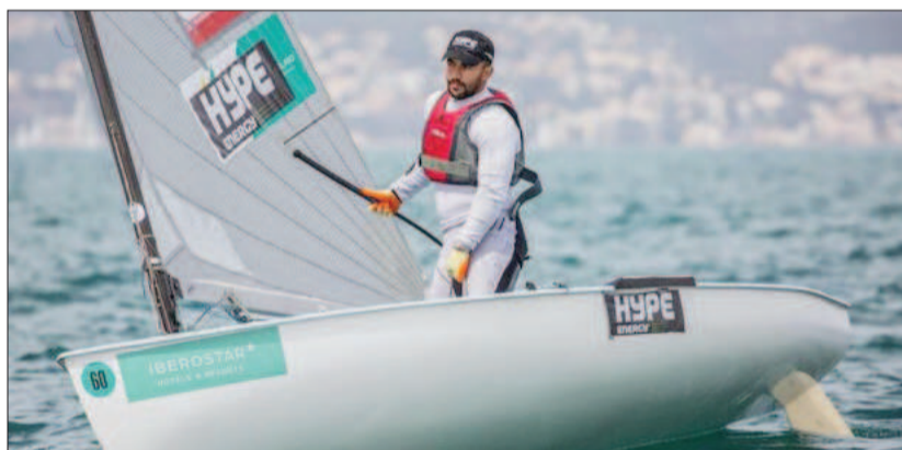
ملی پوش بادبانی: