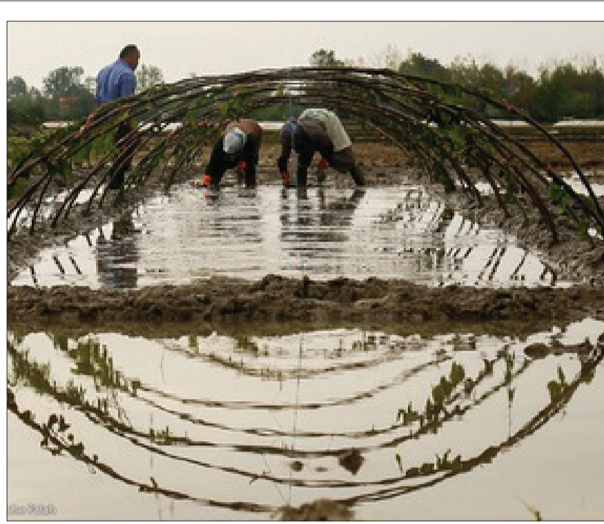
آماده سازی خزانه برنج

بیت‌میدارگان جهانرا بسر بر شوین کسب‌بگون را بم بشکن این طبل خالی میازرا بم بشکن این طبل خالی میازرا بم بشکن این طبل خالی میازرا بم بشکن این طبل خالی میازرا بم بشکن این طبل خالی میازرا بم بشکن این طبل خالی میازرا