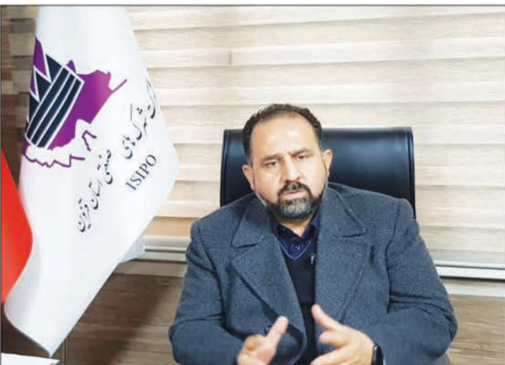
ایم شاهد حضور شرکت های بزرگ صنعتی و بازرگانی کشور در این منطقه باشیم.