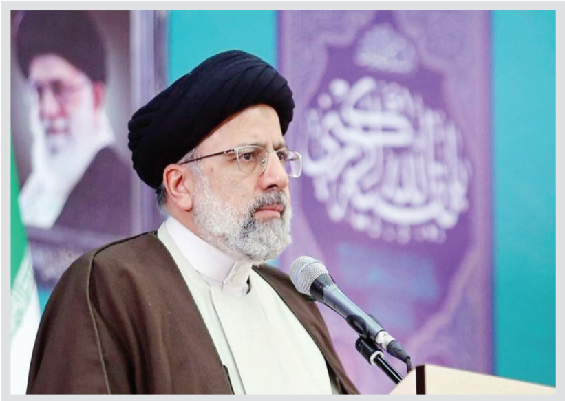
دچار آزمون و خطا ششویم چرا که ۴۰ سال از انقلاب اسلامی می‌گذرد. تمام دست‌اندرکاران و خدمتگزاران در تمام حوزه‌ها

قدرتی که قانون در اختیارش قرار داده است، باید مقتدرانه عمل کند. رئیس دست‌اندرکاران و خدمتگزاران در تمام حوزه‌ها