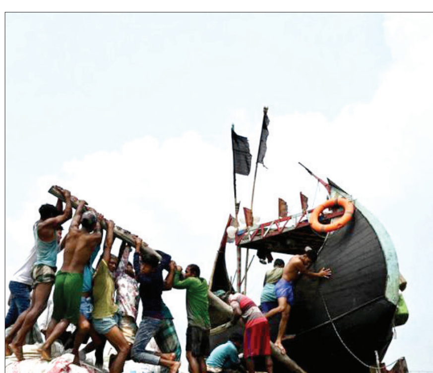
تلاش برای تکان دادن یک قایق ماهیگیری به گل نشسته در خلیج بنگال

یک مطالعه گسترده و جدید نشان می‌دهد که احتمال ابتلا به دیابت پس از ابتلا به کووید-۱۹ به میزان قابل توجهی افزایش می‌یابد. به گزارش ایسنا و به نقل از آ‌آ‌آ، یک تحقیق گسترده نشان داده است افرادی که به کووید-۱۹ مبتلا می‌شوند تا یک سال پس از ابتلا، احتمال بیشتری برای ابتلا به دیابت، به ویژه دیابت نوع ۲ دارند. در واقع طبق گفته محققان، احتمال ابتلا به دیابت نوع ۲ در افرادی که به کووید-۱۹ مبتلا شده‌اند، ۴۰ درصد بیشتر است. بر اساس این مطالعه منتشر شده در مجله Lancet Diabetes & Endocrinology، «یاد‌العلی» محقق ارشد مرکز مراقبت‌های بهداشتی «سنت لوئیس» در میزوری و «شی» اپیدمیولوژیست این مرکز، سوابق مربوط به ابتلا به دیابت نوع ۲ پس از ابتلا به کرونا را بررسی کردند. این مطالعه بیش از هشت میلیون نفر از جمله ۱۸۰ هزار مبتلا به کووید-۱۹ را شامل می‌شد. محققان مشاهده کردند که با افزایش شدت کووید-۱۹، خطر ابتلا به دیابت نیز افزایش یافته است. افرادی که بر اثر ابتلا به کووید-۱۹ در بیمارستان بستری شده بودند یا در بخش مراقبت‌های ویژه بستری شده بودند، در مقایسه با افرادی که مبتلا به کووید-۱۹ نبودند و در بیمارستان بستری نشده بودند یا کارشان به بستری در بخش مراقبت‌های ویژه تکمیده بود، تقریباً چهار برابر بیشتر در معرض خطر ابتلا به دیابت نوع ۲ بودند. این یافته‌ها بنا یافته‌های مطالعه دیگری در آلمان که نسبت به این مطالعه جدید، کوچکتر بود، مطابقت دارد. «العلی» می‌گوید: این خطر، کوچک است، اما ناچیز و قابل چشم‌پوشی نیست، چرا که واضح است که ابتلا به کووید-۱۹ خطر ابتلا به دیابت را تا یک سال بعد افزایش می‌دهد.