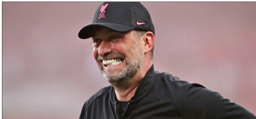
پس از شکست دادن چلسی