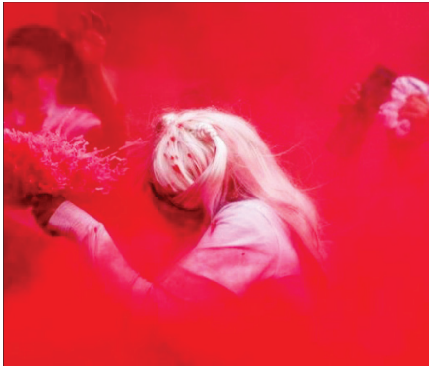
مسابقه دو با پودر رنگی در شهر مسکو روسیه

هلنا بونهام کارتر (انگلیسی: Helena Bonham Carter; زاده ۲۶ مه ۱۹۶۶) بازیگر انگلیسی است. او برای بازی در درام‌های دورانی شهرت دارد و جوایز مختلفی از جمله یک جایزه فیلم بفتا دریافت کرده و نامزد دریافت دو جایزه اسکار و پنج جایزه امی ساعات پربیننده بوده است. بونهام کارتر با بازی در اتاقی با یک چشم‌انداز (۱۹۸۵) و یانو جین (۱۹۸۶) به شهرت رسید. نقش‌های اولیه او در ژانر دورانی و در سبک بودا برای مد غیرعادی، سبک زیبایی‌شناسی تاریک و اغلب بابت بازی در نقش زنان غیرمعمول شناخته شده است. او برای بازی در بال‌های کیوتر (۱۹۹۷) نامزد دریافت جایزه اسکار بهترین بازیگر زن شد و برای بازی در سخنرانی پادشاه (۲۰۱۰) برنده جایزه بفتای بهترین بازیگر نقش مکمل زن شد. او از ۲۰۱۹ تا ۲۰۲۰، شاهدخت مارگارت را در مجموعه تاج از شبکه نتفلیکس به تصویر کشید و برایش دو بار نامزد دریافت جایزه جایزه امی ساعات پربیننده بهترین بازیگر نقش مکمل زن شد. هلنا و تیم برتون نخستین بار هنگام ساخت فیلم سیاره میمون‌ها محصول سال ۲۰۰۱ با هم آشنا شدند. کارگردانی این فیلم را تیم برتون بر عهده داشت و هلنا بونهام کارتر نقش «اری» را بازی می‌کرد. از هنگام ساخت فیلم سیاره میمون‌ها تاکنون، این زوج در ساخت چندین فیلم پر فروش از جمله چارلی و کارخانه شکلات‌سازی، سوپیتی تاد، آلیس در سرزمین عجایب و سایه‌های تاریک همکاری کرده‌اند. آن‌ها در سال ۲۰۱۴، پس از ۱۳ سال زندگی مشترک، از هم جدا شدند. این زوج که هیچ‌گاه با هم ازدواج نکردند، پسری به نام بیلی و دختری به نام نل دارند.