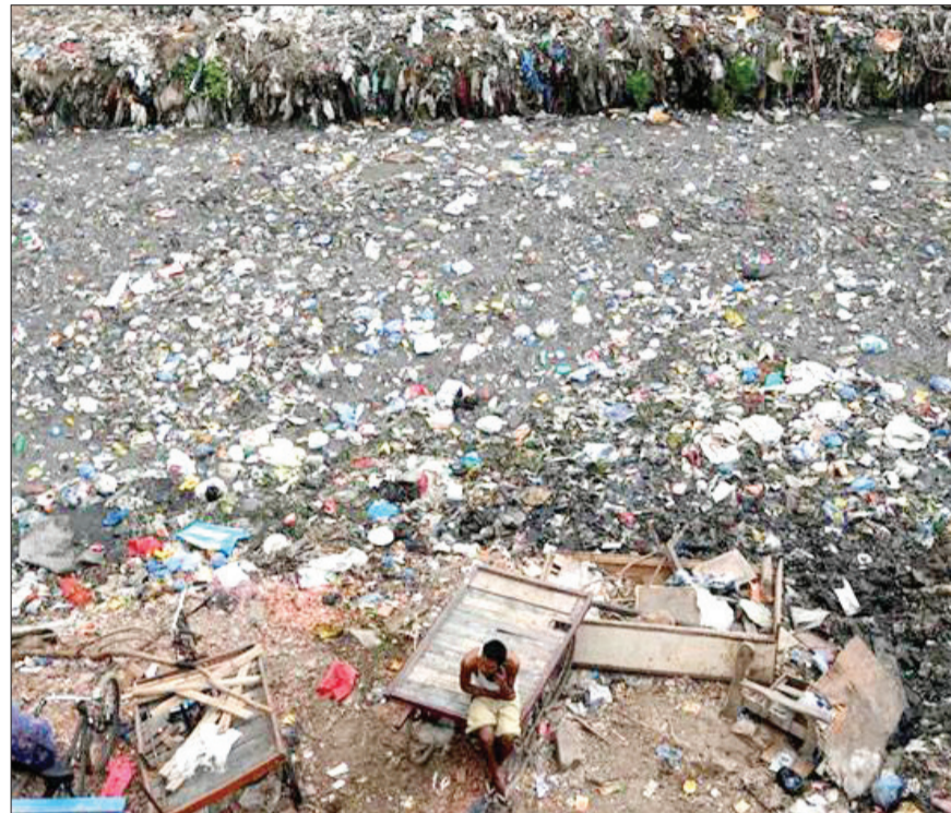
آلودگی زباله ای در یک کانال آبی در شهر دهلی هند

مارک شاگال با نام اصلی «مارک زاخارویچ چاگال» (به فرانسوی: Marc Chagall) (۶ ژوئیه ۱۸۸۷-۲۸ مارس ۱۹۸۵) نقاش برجسته فرانسوی - روسی و از پیشگامان سبک سوررئالیسم است. او به عنوان یکی از پیشروان هنر مدرن، در سبک‌های مختلف هنری ذوق‌آزمایی کرد و تقریباً در تمامی رشته‌های تجسمی مانند نقاشی، تصویرگری، کتاب، سرامیک، نقاشی روی شیشه، نقاشی بر روی دیوار، حکاکی روی فلزات، ترسیم، طراحی صحنه و لباس دست به خلق آثاری ماندگار زد. شاگال با موفقیت توانست سبک‌های هنری کوبیسم، نمادگرایی و فوویسم را با یکدیگر تلفیق کند و با ترکیب بر روی‌های کودکی و افسانه‌پردازی‌های ذهنی خود که همگی ریشه در زادگاهش داشتند، به سبکی کاملاً شخصی و منحصر به فرد دست پیدا کند. جهان غیرمتعارفی که او آفرید آمیزه‌ای از رنگ‌های روشن، حیوانات، گل، انسان‌ها، عشاق، پرندگان و ماهیان در حال نواختن ساز، چهره زن بالدار، علائم یهودی و مسیحی و بیولنی با بال فرشته بود. مارک شاگال در ۲ ژوئیه ۱۸۸۷ در لیونا از توابع منطقه ویتبسک روسیه که امروزه یکی از منطقه‌های بلاروس است در خانواده پرجمعیت یهودی لیتوانیایی متولد شد. در آن زمان ویتبسک حدود ۶۶ هزار نفر جمعیت داشت که حدود نیمی از آن‌ها یهودی بودند. مارک که در آن زمان موشه نام داشت نخستین فرزند از ۹ فرزند والدینش بود. پدرش کارگر و انباردار یکی از بازرگانان ماهی دودی بود و مادرش یک خواربارفروشی کوچک را اداره می‌کرد. با وجود آنکه پدرش به سختی کار می‌کرد اما درآمد ناچیزی داشت. شاگال در تاریخ ۲۸ مارس ۱۹۸۵ در منزل شخصی خودش در شهر سن پائول در جنوب فرانسه درگذشت. او در هنگام مرگ ۹۷ سال داشت و در کلیسای سن پائول در جنوب شرقی فرانسه به خاک سپرده شد.