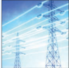
وزیر نیرو هشدار داد