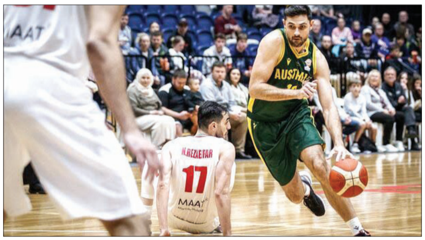
فیبا اعلام کرد: استرالیا نمی‌آید