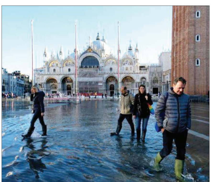
شهر ونیز ایتالیا

محققان دانشگاه آرهوس دانمارک در مطالعه اخیرشان به بررسی اینکه چگونه تنفس مغز ما را شکل می‌دهد، پرداخته‌اند. به گزارش ایسنا و به نقل از تی ان، اثر آرام‌بخش تنفس در موقعیت‌های استرس زا، مفهومی است که بیشتر ما با آن آشنا هستیم. اکنون پروفیسور میکا آلن از دپارتمان پزشکی بالینی دانشگاه آرهوس یک قدم به درک اینکه چگونه نفس کشیدن مغز ما را شکل می‌دهد، نزدیک شده است. در این مطالعه محققان نتایج بیش از ۱۰ مطالعه را با نتایج تصویربرداری از مغز کودکان، میمون‌ها و انسان ترکیب کردند و از آن برای ارائه یک مدل محاسباتی جدید استفاده کردند که توضیح می‌دهد چگونه تنفس ما بر ساختار مغز تأثیر می‌گذارد. محققان گفتند: آنچه ما دریافته‌ایم، این است که در انواع مختلف کارها، ریتم‌های مغز با ریتم تنفس ما ارتباط نزدیکی دارد. وقتی عمل دم را انجام می‌دهیم، ما نسبت به دنیای بیرون حساس‌تر هستیم، در حالی که وقتی نفس را بیرون می‌دهیم، مغز بیشتر کوک می‌شود. پروفیسور میکا آلن توضیح داد که این با نحوه استفاده از تنفس در برخی ورزش‌های شدید همخوانی دارد، برای مثال تیراندازان حرفه‌ای آموزش دیده‌اند که ماشه را در انتهای بازدم بکشند. میکا آلن توضیح داد که این مطالعه نشان می‌دهد که تنفس چیزی بیش از کاری است که ما برای زنده ماندن انجام می‌دهیم. این نشان می‌دهد که مغز و تنفس به گونه‌ای در هم تنیده شده‌اند که بسیار فراتر از بقا عمل می‌کنند و در واقع بر احساسات، توجه ما و نحوه پردازش ما از دنیای خارج تأثیر می‌گذارد. مدل ما نشان می‌دهد که مکانیسم مشترکی در مغز وجود دارد که ریتم تنفس را به این رویانها مرتبط می‌کند.