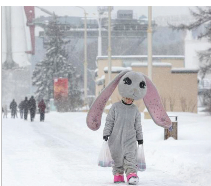
بارش برف در شهر مسکو روسیه

متخصص تولید عطر گرد هم آمدند و نوعی عطر باستانی متعلق به تمدن بین‌النهرین را بار دیگر تولید کردند. به گزارش ایسنا به نقل از انشنت اورینت، گروهی از متخصصان تولید عطر در ترکیه موفق شدند فرمول یک عطر باستانی بین‌النهرینی را بار دیگر تولید کنند. در ساخت این عطر سه‌هزار و ۲۰۰ ساله از گیاهان بومی منطقه بین‌النهرین استفاده شده است. این عطر اکنون در کلیسای تاریخی «سنت جورج» واقع در شهر دیاربکر کشور ترکیه به نمایش گذاشته شده است. به گفته شهردار «دیاربکر»، تعدادی از نمونه‌های بازخلق شده بطری‌های عطر چند هزارساله به همراه نمونه‌ای از این عطر باستانی بین‌النهرینی برای مردم به نمایش گذاشته شده است. این عطر که در ساخت آن از گیاهان مخصوص بخش‌های شمالی بین‌النهرین استفاده شده، «سیسایا» نام گرفته است. این نام برگرفته از نام الهه گندم و نوشتار بین‌النهرینی است. «سیسایا» یکی از قدیمی‌ترین الهه‌های سومری محسوب می‌شود. «دیاربکر» خانه تمدن‌های باستانی بسیاری از جمله سومری، آشوری، بابل و هیتی‌ها بوده است. این مکان به عنوان یک مرکز مهم برای تولید عطر و توقفگاه حیاتی برای تاجران عطر محسوب می‌شد. این عطرهای باستانی بین‌النهرینی در بطری‌هایی از جنس شیشه‌های مخصوص یا محفظه‌های سرامیکی نگهداری می‌شدند. در نمایشگاهی که اخیراً در «دیاربکر» برگزار شده است، نمونه‌های بازخلق شده از بطری‌های عطر به نمایش گذاشته شدند که در کاوش‌های باستان‌شناسی کشف شده‌اند. بطری‌های اصلی در یک قلعه سه‌هزار ساله کشف شدند که در دوران حکومت امپراتوری روم به عنوان پایگاه نظامی مورد استفاده قرار می‌گرفت. یک متخصص سرامیک و ظروف شیشه‌ای باستانی بر ساخت نمونه‌های مشابه این بطری‌های عطر نظارت داشته است.