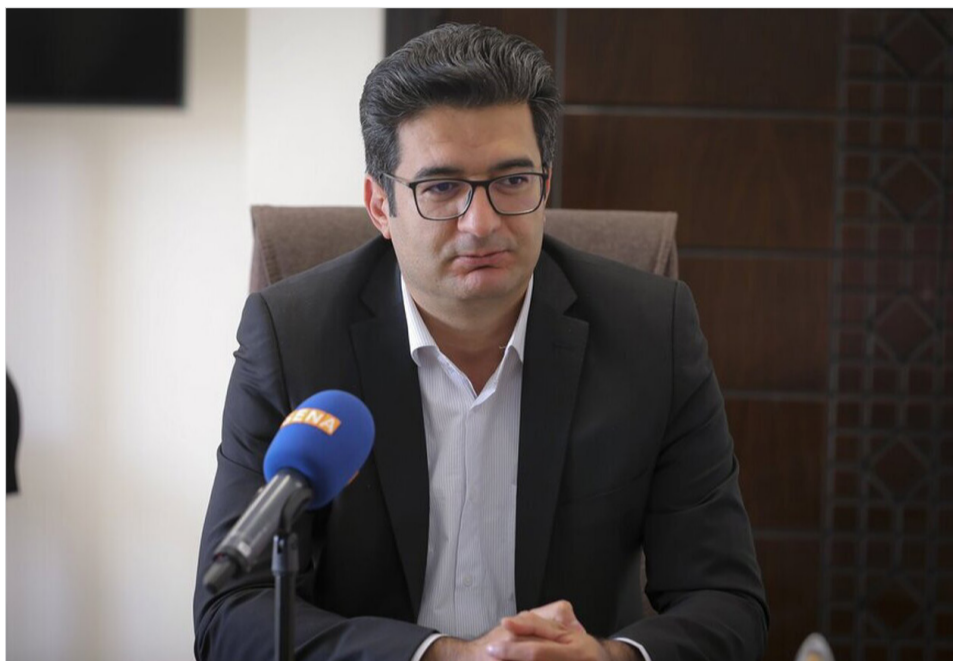
مدیر نظارت بر بازار اولیه سازمان بورس اعلام کرد: