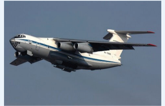
سازمان ثبت اسناد و املاک کشور اداره ثبت شرکت ها و موسسات غیرتجاری تهران (۱۴۸۵۷۸۹)