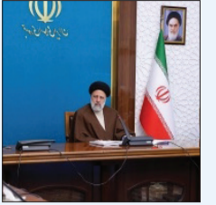
در جلسه شورای عالی هماهنگی اقتصادی سران قوا انجام شد؛