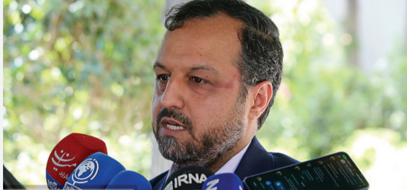
وزیر امور اقتصاد و دارایی گفت: در شرایط کنونی استیضاح وزرا کمکی به هماهنگی وزرا و ثبات سیاست‌های اقتصادی نخواهد داشت و وزارتخانه‌ها را ممکن است چندین ماه

وزرا به حل مشکلات و هماهنگی اعضای دولت کمک نمی‌کنند به گزارش خبرنگار ایلنا، سید احسان خاندوزی وزیر امور اقتصادی و دارایی ظهر امروز در حاشیه جلسه هیات دولت در جمع خبرنگاران با اشاره به آخرین وضعیت تدوین و تنظیم بسته پیشنهادی دولت در حوزه مهار تورم و رشد تولید، گفت: بسته پیشنهادی دولت برای مهار تورم و رشد تولید که به تأیید مشترک بانک مرکزی، وزارت اقتصاد و دارایی و سازمان برنامه و بودجه رسیده امروز برای اخذ نظر تشکل‌های اقتصادی تولیدی کشور و اتاق‌های سه‌گانه ارسال شد. برای اینکه ما نظرات بخش غیردولتی را هم داشته باشیم و ان‌شاءالله ظرف روزهای آینده پس از اخذ نظر فعالان بخش غیردولتی با حضور آقای رئیس‌جمهور این جزئیات نهایی و ابلاغ خواهد شد. وی افزود: امیدواریم که با توجه به هدفگذاری‌های دقیقی که در بسته ۱۰ بندی برای مهار تورم و رشد تولید وجود دارد، ما بتوانیم یک سند هماهنگ‌کننده بین تمام اجزاء دولت را در خصوص نیل به