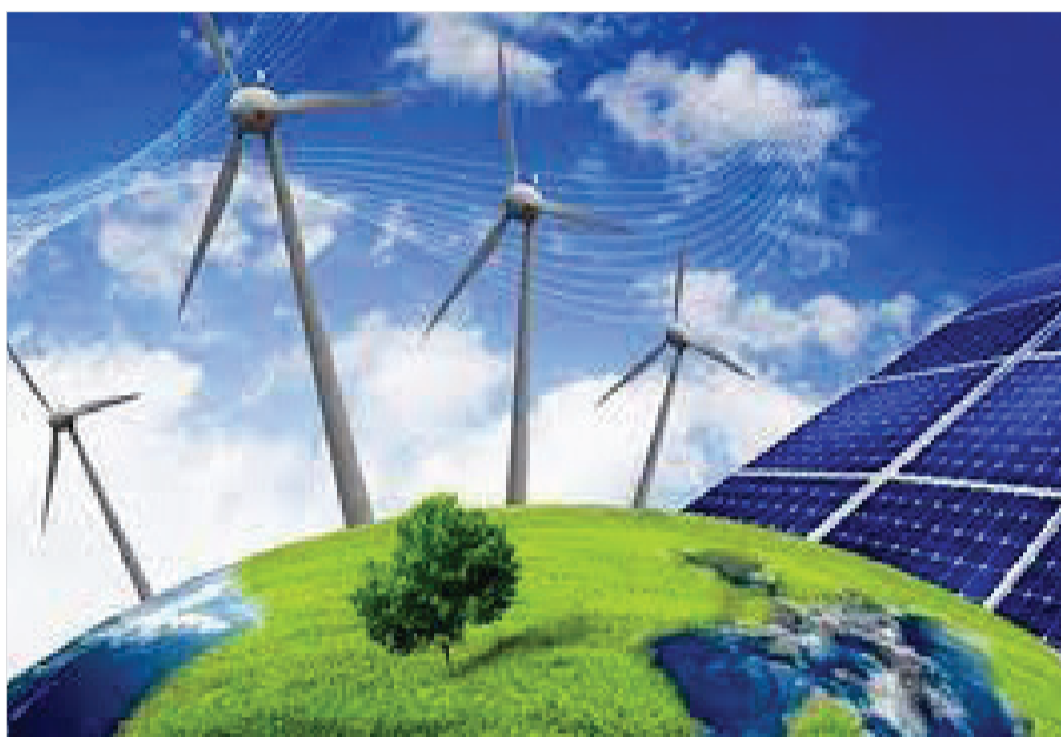
آژانس بین‌المللی انرژی: