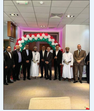
با حضور سفیر ایران در مسقط انجام شد؛