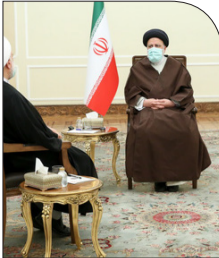
به میزبانی رئیسی؛