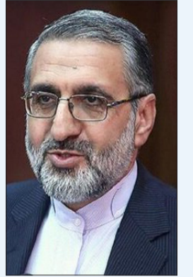
در حاشیه جلسه دولت مطرح شد