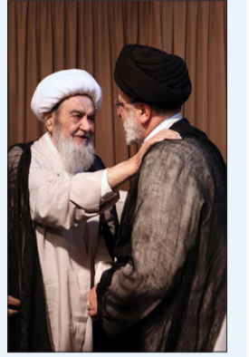
رئیس‌ی در دیدار با آیت‌الله مظاهری تشریح کرد: