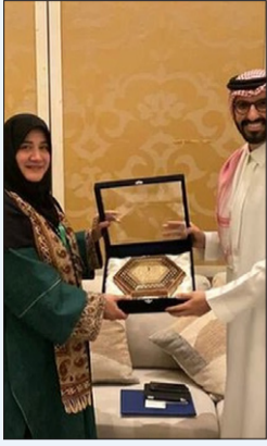
رئیس‌ی در آیین افتتاحیه پنجمین دوره اعطای جایزه علمی و فناوری مصطفی (ص):