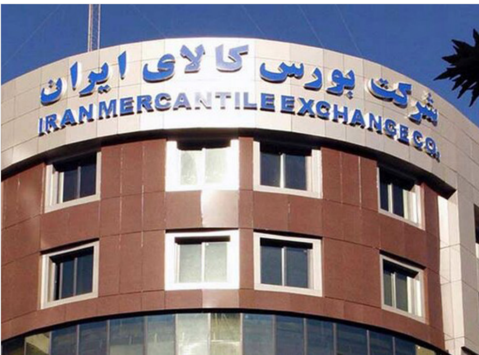
رئیس سازمان بورس اعلام کرد