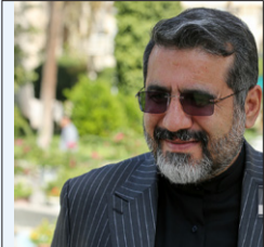
وزیر فرهنگ و ارشاد اسلامی: