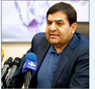
در جلسه‌ای به ریاست مخبر جمهور انجام شد؛