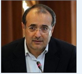
غضنفری عنوان کرد