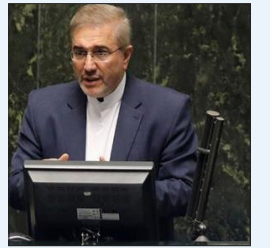
رئیس سازمان برنامه و بودجه: