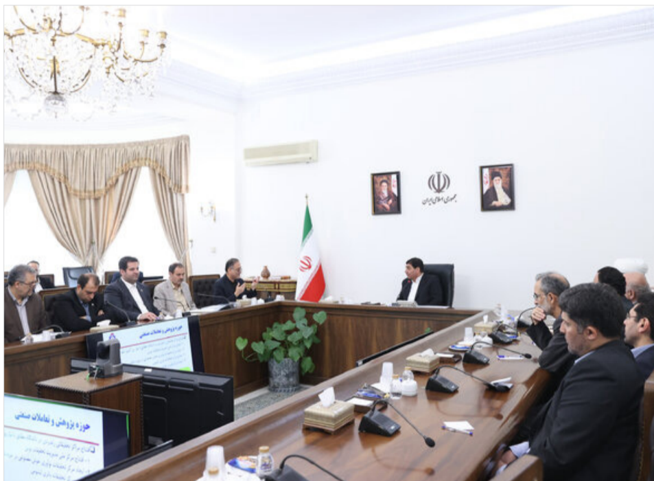
مخبر در دیدار با هیات رئیسه دانشگاه علم و صنعت تاکید کرد