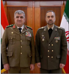
در گفت‌وگوی تلفنی وزرای دفاع ایران و سوریه مطرح شد