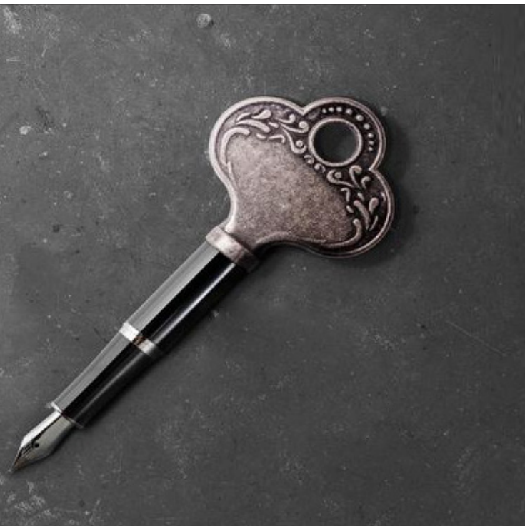
شناخت و معرفت کلید قفل ها!