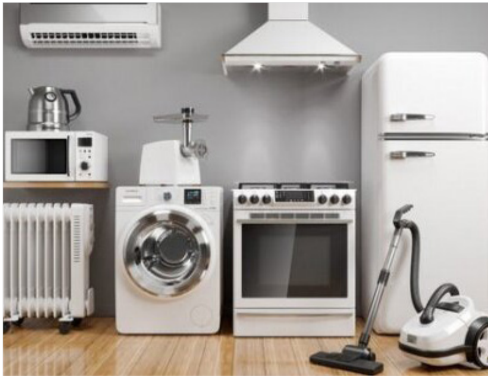
دیدار کل انجمن صنایع لوازم خانگی

نمایندگان مجلس شورای اسلامی با اصرار بر مصوبه خود در طرح اصلاح سازوکار تخصیص قیر رایگان به دستگاه‌های اجرایی برای پیشبرد پروژه‌های عمرانی کشور، آن را به مجمع تشخیص مصلحت فرستادند. به گزارش ایسنا، نمایندگان مجلس شورای اسلامی در جلسه علنی نوبت صبح امروز یکشنبه، طرح اصلاح بندک تبصره ۱ قانون بودجه سال ۱۴۰۲ کل کشور را به منظور رفع ایراد شورایی نگهبان بررسی و بر مصوبه قبلی خود اصرار کردند. بر اساس مصوبه مجلس؛ در سال ۱۴۰۲ وزارت نفت مکلف است معادل مبلغ ۲۰۰ هزار میلیارد ریال نفت خام از محل منابع در اختیار شرکت ملی نفت ایران را در اختیار پالایشگاه‌ها قرار داده و به میزان آن به صورت ماهانه از ابتدای سال ۱۴۰۲ مواد اولیه قیر با ۵۰ درصد قیمت بورس در اختیار دستگاه‌های اجرایی موضوع این بند قرار دهد و در حساب‌های فی مابین خود و خزانه کل کشور اعمال و آن را از محل خوراک تحویلی تسویه نماید. وزارت نفت مکلف است مابه‌التفاوت آن را با تعدیل قیمت ماهانه خوراک از طریق شرکت ملی پالایش و پخش فرآورده‌ها جبران و اعمال حساب نماید. در صورت کاهش قیمت قیر، مقدار قیر تحویلی به دستگاه‌های اجرایی موضوع این بند افزایش می‌یابد. مهلت هزینه‌کرد اعتبار موضوع این بند تا پایان شهریورماه ۱۴۰۳ است. با توجه به ایراد شورای نگهبان برای بار دوم بر روی این طرح و اصرار نمایندگان بر مصوبه قبلی خود، اکنون این طرح به مجمع تشخیص مصلحت می‌رود.