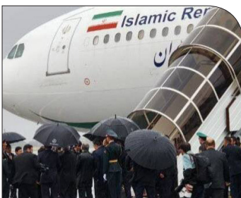
به منظور انجام دیداری دوجانبه؛