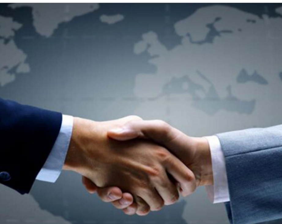
طی سال جاری محقق شد