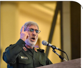
پیام سردار قالی به فرمانده گردان‌های القسام: