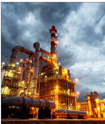
برای اولین بار در دنیا صورت گرفت؛