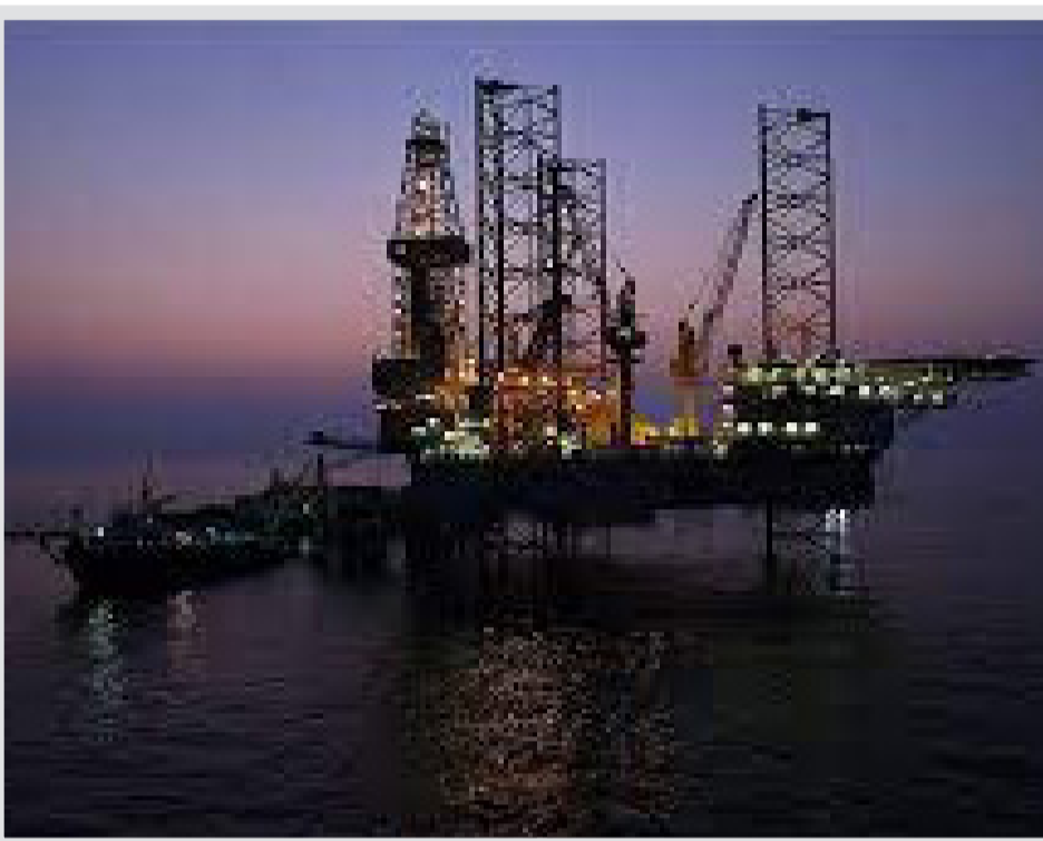
معاون وزیر نفت: