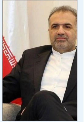
سفیر ایران در روسیه: