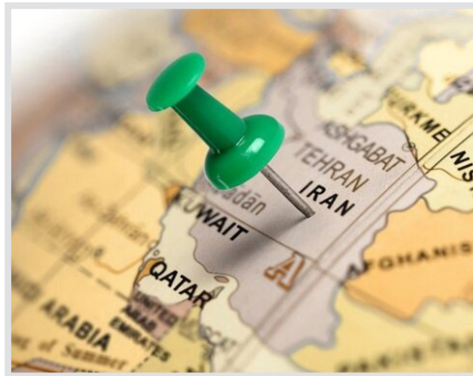
وزیر اقتصاد خبر داد؛