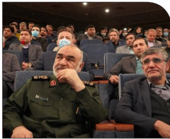
با حضور فرمانده کل سپاه؛