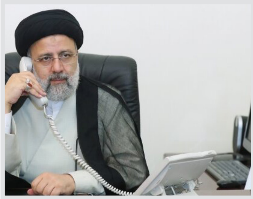
بهادری جهمی در حاشیه جلسه هیئت دولت:

رئیس جمهور با اشاره به تداوم جنایات و نسل‌کشی رژیم صهیونیستی علیه مردم مظلوم و مقتدر غزه و ناکارآمدی سازمان‌های بین‌المللی برای توقف این جنایات، بر اهمیت اقدام هماهنگ کشورهای اسلامی در راستای اعمال فشار به این رژیم برای توقف ماشین کشتار و جنایت در غزه تأکید کرد. به گزارش ایسنا، سید ابراهیم رئیسی بعد از ظهر امروز - چهارشنبه - در گفت‌وگوی تلفنی با عارف رحمان علوی رئیس جمهوری اسلامی پاکستان با اشاره به تداوم جنایات و نسل‌کشی رژیم صهیونیستی علیه مردم مظلوم و مقتدر غزه و ناکارآمدی سازمان‌های بین‌المللی برای توقف این جنایات، بر اهمیت اقدام هماهنگ کشورهای اسلامی برای اعمال فشار به این رژیم برای توقف ماشین کشتار و جنایت در غزه تأکید کرد. وی همچنین بر ضرورت تلاش بیشتر پاکستان برای ارتقای امنیت مرزها تأکید کرد و ضمن اشاره به ظرفیت‌های فراوان دو کشور برای گسترش همکاری‌ها به ویژه در عرصه‌های انرژی، ابرار امیدواری کرد که مقامات دو کشور با جدیت بیشتر برای بالفعل کردن این ظرفیت‌ها بکوشند.