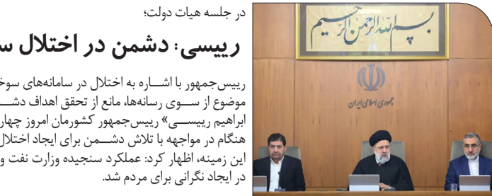
در جلسه هیات دولت؛