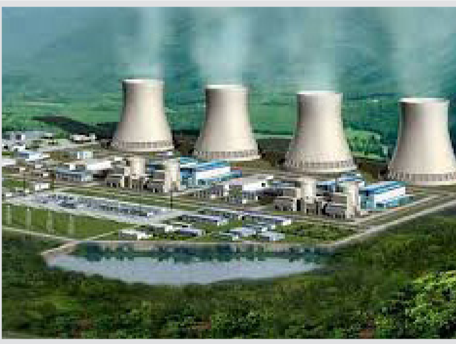
در جریان بازدید از سازمان تات مطرح شد

وزیر نیرو از افزایش ۱۱۳۷ مگاواتی توان تولید برق نیروگاه سیکل ترکیبی رودشور خبر داد. به گزارش خبرگزاری مهر به نقل از وزارت نیرو، علی اکبر محرابیان صبح امروز شبیه دومی ماه در بازدید از نیروگاه رود شور استان مرکزی گفت: نیروگاه رود شور یکی از نیروگاه‌های مهم کشور است که کار بزرگ و بی‌نظیری در بخش بخار آن در حال اجرا است. وی با اشاره به اینکه واحد بخار نیروگاه رود شور در کلاس F احداث می‌شود، تصریح کرد: این نیروگاه هم اکنون با برخورداری از سه واحد گازی به ظرفیت ۷۹۲ مگاوات در حال فعالیت است که برای اولین بار در منطقه قرار است در این طرح با آرایش ۳-۲-۱ (سه توربین گاز، سه بویلر و یک توربین بخار) سه واحد گازی و یک واحد بخار به یکدیگر متصل شوند که این اقدام پیش از تنها در ۱۰ نیروگاه جهان انجام شده است. وزیر نیرو با تأکید بر ضرورت برنامه‌ریزی و زمان‌بندی دقیق برای اجرای به موقع واحد بخار این نیروگاه ادامه داد: باید با در نظر گرفتن تمام جزئیات و محاسبات دقیق مهندسی، عملیات نصب و راه اندازی تجهیزات این نیروگاه به گونه‌ای پیش برود که بتوانیم در تابستان ۱۴۰۳ واحد بخار نیروگاه رود شور را به شبکه برق سراسری متصل کنیم. محرابیان با اشاره به کار ارزشمند و مهمی که در نیروگاه رود شور با هدف افزایش توان تولید برق تا ۱۱۳۷ مگاوات آغاز شده است، تصریح کرد: افزایش توان تولید برق این نیروگاه چه به لحاظ مکانیکی که در مجاورت دو استان صنعتی با نیاز مصرف برق بالا قرار دارد و چه به لحاظ زمانی که ما وارث نارتازی قابل توجه در تولید و مصرف برق هستیم از اهمیت بالایی برخوردار است.