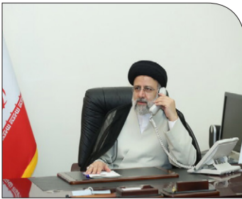
گفت‌وگوی تلفنی روسای جمهور ایران و مصر