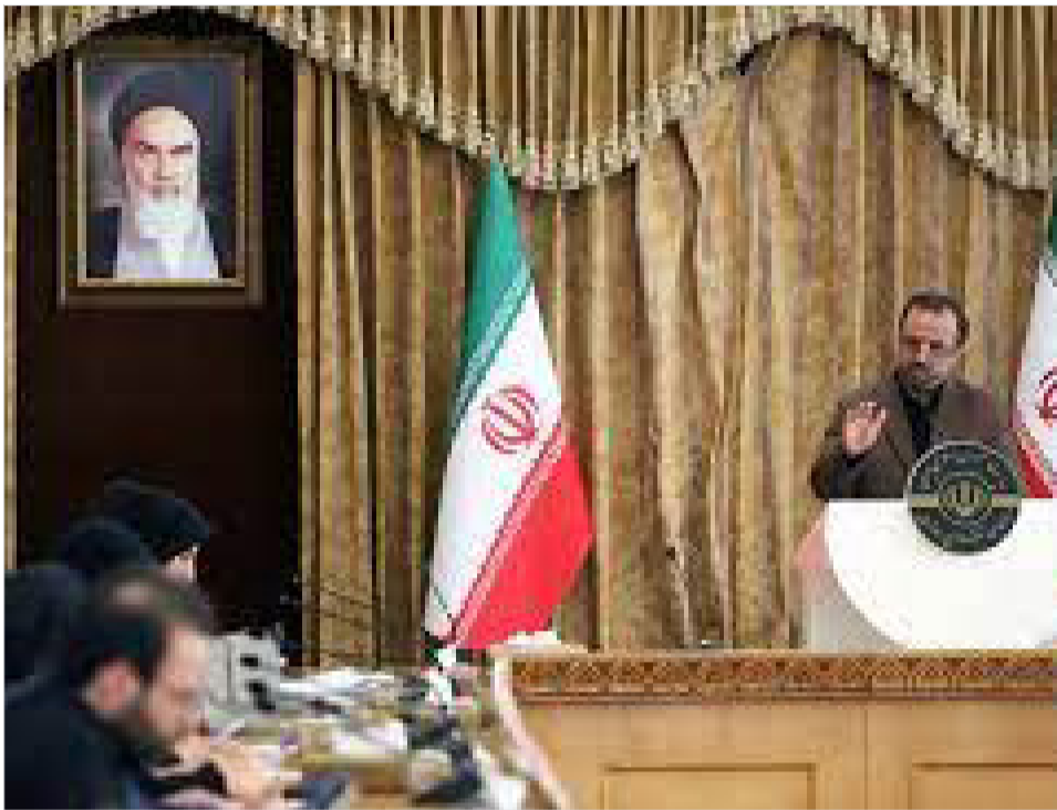
سخنگوی اقتصادی دولت اعلام کرد