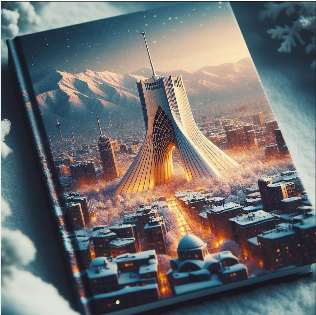
قابی از ایران !!