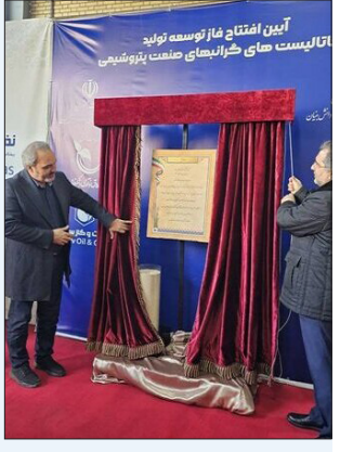
خاندوزی اعلام کرد

در شهرک عباس آباد خط تولید کاتالیست هیدروژناسیون استیلان مورد نیاز پتروشیمی افتتاح شد. به گزارش ایسنا، امروز در کارخانه یکی از شرکت‌های دانش‌بنیان، فاز توسعه تولید کاتالیست‌های گرانبهای صنعت پتروشیمی راه‌اندازی شد. خط تولید کاتالیست هیدروژناسیون استیلان با حمایت صندوق نوآوری و شکوفایی راه‌اندازی شده است که امروز خط تولید کاتالیست هیدروژناسیون استیلان و فاز توسعه کارخانه برای تولید این نوع کاتالیست افتتاح شد. کاتالیست هیدروژناسیون استیلان برای حذف ناخالصی استیلان از محصول اتیلن واحدهای ائین مورد استفاده قرار گرفته و خود اتیلن نیز در صنایع پلیمری برای تولید پلی اتیلن استفاده می‌شود. عدم حذف این ناخالصی باعث مسوم شدن کاتالیست و توقف فرآیند تولید پلی اتیلن می‌شود که خسارات مالی فراوانی را در پی خواهد داشت.