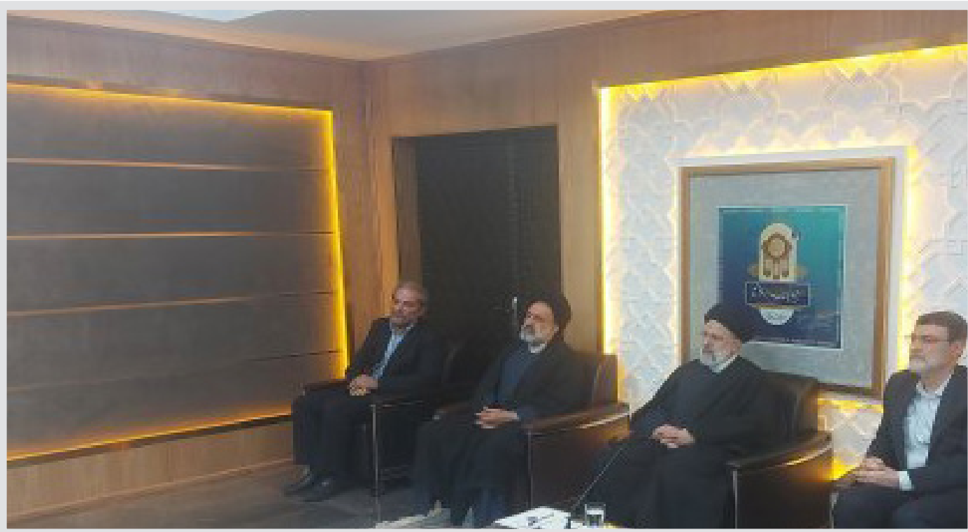
بر روی این سامانه دارای پرونده الکترونیک هستند و می‌توانند اطلاعات و آخرین وضعیت ایثارگری خود را بر روی آن مشاهده کنند.