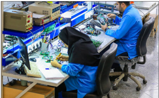
معاون بنیاد ملی نخبگان اعلام کرد: