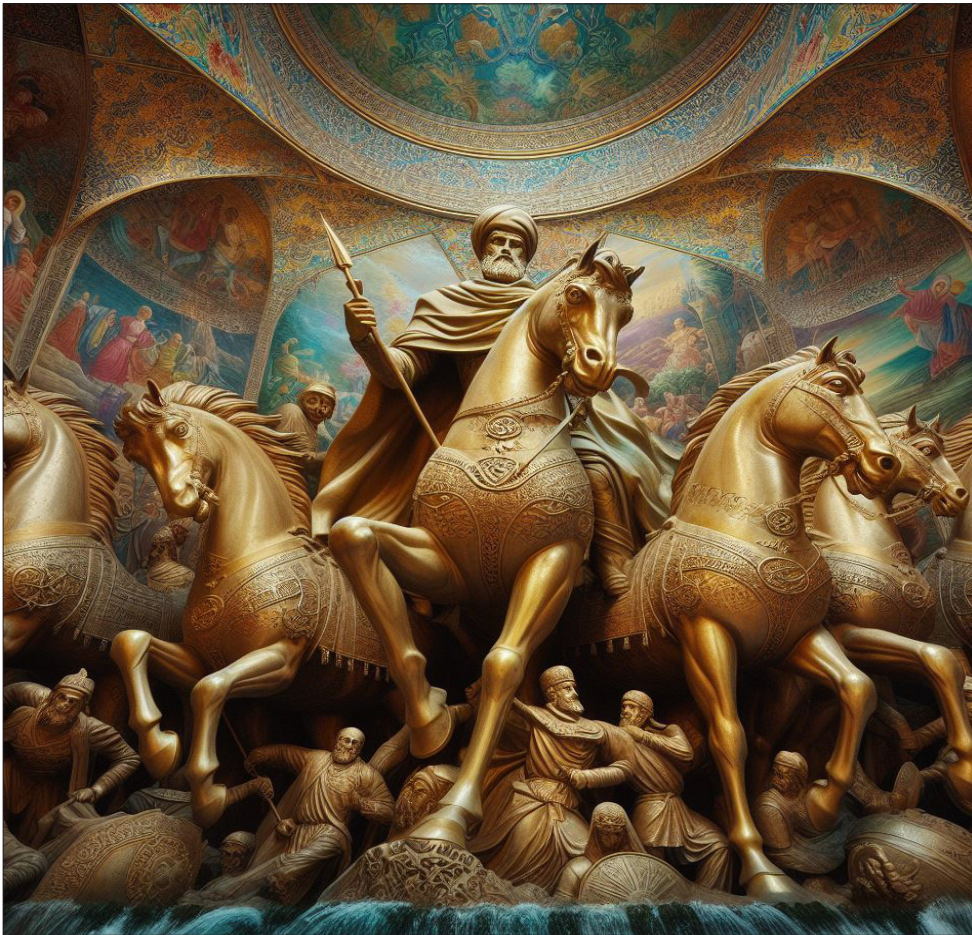
تندیس رستم پهلوان شاهنامه سوار بر اسب!!

سازمان صداوسیما در بخش حمایت تبلیغاتی از سکوها و کسب و کارهای مشمول مربوط به ماده ۲ این نامه در خصوص ممنوعیت تبلیغ سکویهای مشابه خارجی در برنامه‌های این سازمان، تکلیف خود را از نظر دستگاه و سکویهای مشمول انجام داده است اما در خصوص تبلیغ معرفی به مدت ۶ ماه و تبلیغ و معرفی سکویهای مشمول بر اساس تعرفه فرهنگی تکالیف این نامه را انجام نداده است. سازمان صدا و سیما همچنین در بخش حمایت تبلیغاتی از سکوها و کسب و کارهای مشمول مربوط به جز بند سه ماده ۳ در خصوص انتقال کلیه اطلاعات سازمان صداوسیما به سکویهای داخلی تکلیف خود را از نظر دستگاه و از نظر تحقق از دیدگاه کاربر انجام داده است. همچنین در جز بند سه ماده ۳ این بخش در خصوص برنامه سازی برای معرفی به عموم مردم و مخاطبین تخصصی موفق به انجام تکلیف خود نشده است.