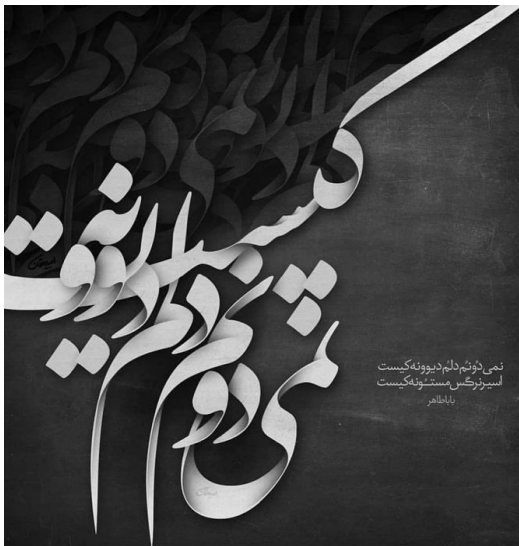
نمی‌دانم، ولی می‌دانم که... اسیر یک مستطیل است بناهم