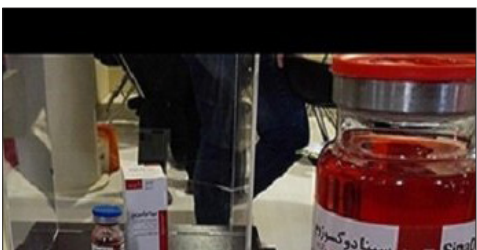
یک شرکت دانش بنیان اعلام کرد: