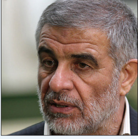
آیت الله العظمی خرمنه ای

رئیس کمیسیون امور داخلی کشور و شوهارا در مجلس شورای اسلامی تاکید کرد: شهید آیت الله رئیسی همواره برای حل مشکلات مردم دغدغه داشت و یک عنصر خدوم بدون چشم‌داشت برای نظام بود. محمداصلاح جوکار در گفت و گو با ایسنا با اشاره به خدمات شهید سید ابراهیم رئیسی در مقاطع مختلف، بیان کرد: حضرت آیت الله رئیسی خادم ملت بود. بنده زمانی که ایشان تولیت آستان قدس بودند نماینده آستان یزد بودم، نگاه ایشان در جایگاه تولیت آستان قدس این بود که کرامت امام (ع) باید شامل حال همه ملت ایران شود. یکی از اقدامات خوبی که ایشان داشتند بحث خادمی یاران امام رضا بود که به کل کشور بست دادند و در ادامه اظهار کرد: ایشان همواره برای مردم و محرومان دغدغه خاطر داشت. می‌توان به ایشان لقب سید محرومان و خادم ملت ایران را داد. در طول این سه سال ریاست جمهوری ایشان حضور آیت الله رئیسی در بین مردم بی سابقه بود. ایشان همواره در کنار مردم بود. یادم هست زمانی که ایشان برنامه هفتم را به مردم ارائه کردند، تاکید داشتند که مبتنی بر مسائل کشور تنظیم شده است. دغدغه خاطر ایشان حل مسائل و مشکلات کشور بود. نماینده مردم یزد در مجلس شورای اسلامی تصریح کرد: در حوزه فرهنگ ایشان دیدگاه والایی داشتند. روحیه جهادی در وجود ایشان تبلور داشت. رسیدگی به مشکلات کشور مهم ترین دغدغه ایشان بود. آیت الله رئیسی یک عنصر خدوم بدون چشم‌داشت بود. در هر شرایط و هر زمانی آماده به کار بودند. ایشان یک فرصت استثنایی برای کشور و ملت ما بود. این ضایعه بسیار دردناک بوده که جبران آن به سادگی ممکن نیست. ما چنین شخصیتی را از دست دادیم. امیدوارم اقداماتی که ایشان شروع کردند و آن حرکت جهادی ادامه پیدا کند.