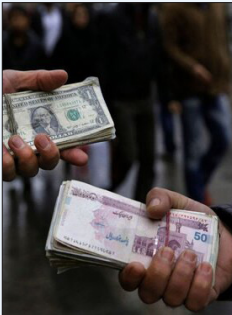
منجر به شهادت رئیس جمهور و همراهانش شد،باز غیر رسمی ارز تاشب خورد، روند صعودی بالایی را طی کرد و حتی دلار به مرز ۶۲ هزار تومان رسید.اما از روز بعد نرخ دلار در این بازار با روند کاهشی به حالت تعادل و نرخ روزهای قبل خورد بازار گشت.