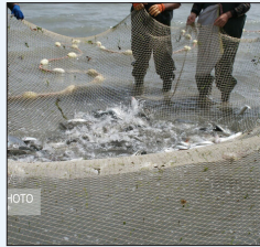
مدیر کل شیلات خوزستان: