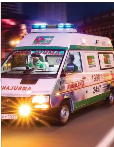
با فناوری ۵G