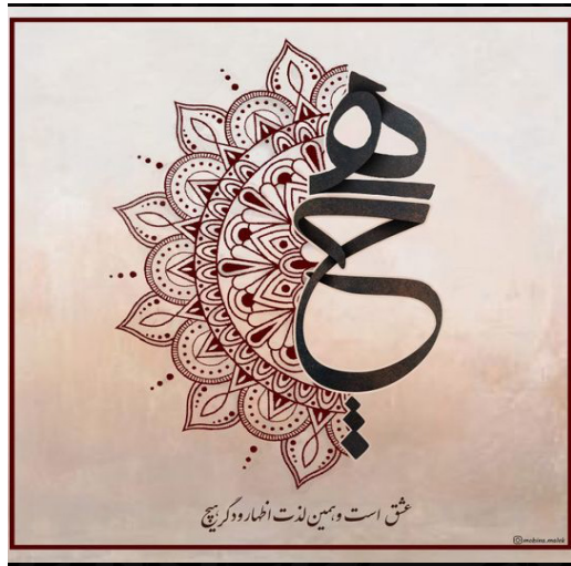
عشق است و بسین لذت افکار و کویچ