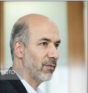
وزیر نیرو اعلام کرد

یکشنبه ۱۳ خرداد ۱۴۰۳ ۲۴ ذی القعدة ۱۴۴۵ ۲ ژوئن ۲۰۲۴