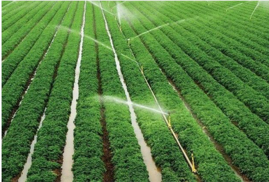
رئیس سازمان تحقیقات، آموزش و ترویج کشاورزی عنوان کرد