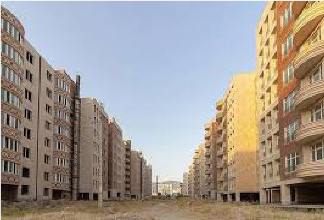
مدیرعامل صندوق ملی مسکن عنوان کرد