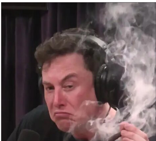
گزارش جدید فاش کرد