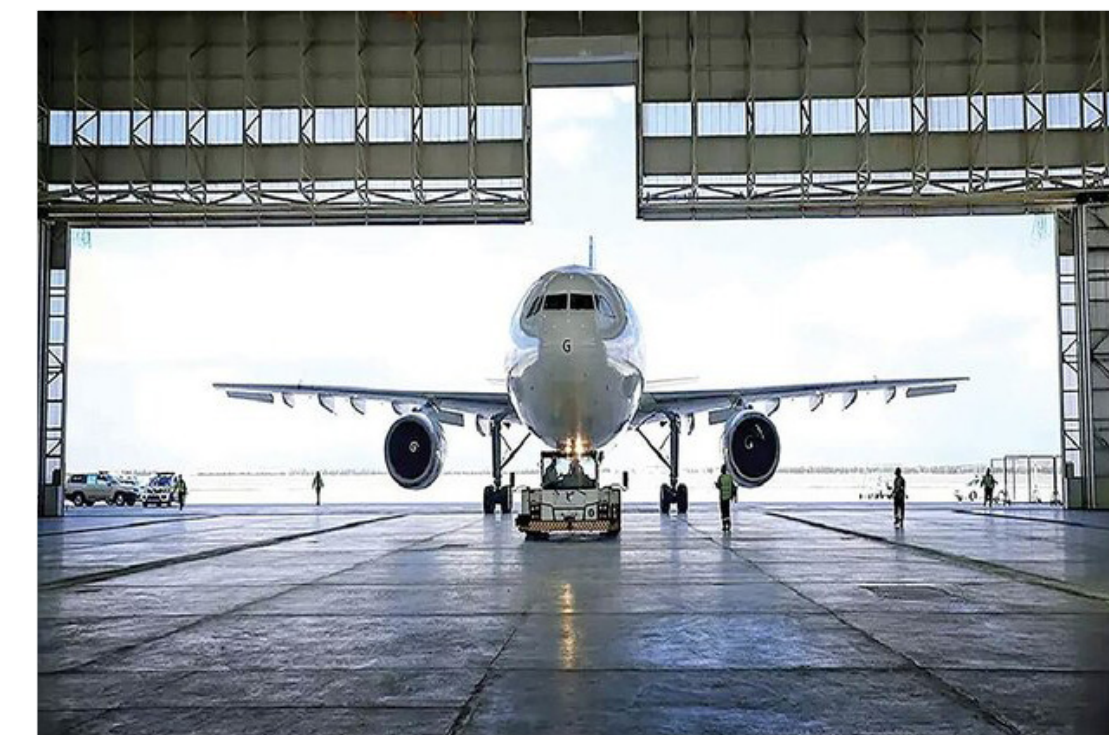
دست‌آورد جدید دانش‌بنیان‌ها در صنعت هوایی