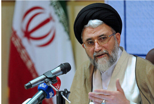
با حضور مخبر انجام شد.

جمهور شهید و دولت و مجلس و شعام و قانون بودجه توانستیم زیرساخت‌های فنی و فناوری را گسترش دهیم و با رژیم صهیونیستی و کشورهای مختلف قدرتمند به خوبی مقابله کنیم. وی در پایان گزارش خود از سه سال حضور در راس وزارت اطلاعات گفت: ما در این مدت موفقیت بزرگی بدست آوردیم و توانستیم کسانی که به ناحق و مظلومانه توسط رژیم‌های مختلف و غربی به اسارت گرفته شده بودند، با تعامل و هم‌افزایی با وزارت امور خارجه موفق به آزادی آنها شویم.