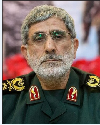
در نامه‌ای خطاب به یحیی سنوار

فرمانده نیروی قدس سپاه در نامه‌ای به یحیی سنوار رئیس جدید دفتر سیاسی حماس بر انتقام‌گیری خون شهید اسماعیل هنیه تأکید کرد. به گزارش ایسنا، در بخش‌هایی از این نامه آمده است: «عروج شهید اسلام سردار اسماعیل هنیه را تسلیت عرض می‌کنم. شهید هنیه واقعا از رهبران دلاور مقاومت اسلامی و شخصیتی ارزشمند و متین بود که در جهان اسلام وحدت ایجاد کرد. همانطور که رهبر انقلاب فرمودند وظیفه خود می‌دانیم که انتقام خون ایشان را برای این حادثه تلخ در جمهوری اسلامی بگیریم. تردیدی نیست که خون این شهید بزرگوار بر مجازات سخت رژیم صهیونیستی به دست جمهوری اسلامی تأثیر خواهد گذاشت. جهاد قهرمانانه برادران شما در مقاومت اسلامی، تأثیر مجازات را بیش از گذشته خواهد کرد و به محو شدن هر چه سریعتر این پدیده نوحس منجر خواهد شد. انتخاب جناب‌عالی را به عنوان شخصیتی با سابقه و پرافتخار در بعد رهبری و جهادی، به همه قهرمانان حماس، غزه و ملت فلسطین تبریک می‌گویم. حماس با انتخاب یک رهبر با منطق دیگر ثابت کرد که پرچم پر افتخار حماس را به دست کسی می‌دهد که بیشترین نفوذ را در میدان دارد و مجاهد فی سبیل الله است.»