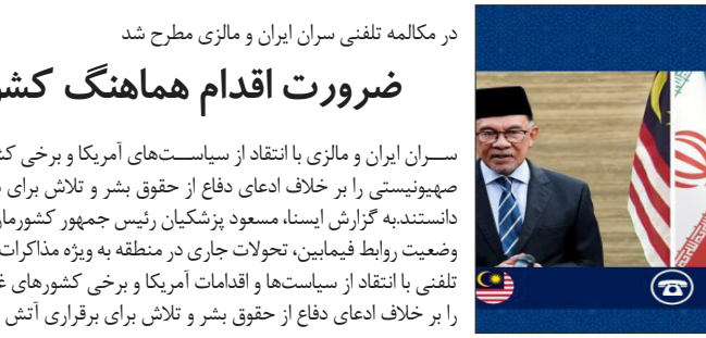
در مکالمه تلفنی سران ایران و مالزی مطرح شد

طبق اعلام گمرک، در سه هفته اخیر ۳۵ دستگاه اتوبوس اظهاری برای تسهیل در تردد زوار اربعین حسینی (ع) از گمرکات بازرگان و تهران با حداقل تشریفات و با کمترین زمان ممکن ترخیص شده است.به گزارش ایسنا، از این تعداد، ۲۱ دستگاه اتوبوس از گمرک تهران و ۱۴ دستگاه اتوبوس از گمرک بازرگان پس از اظهار و اخذ مجوزهای مربوطه، در سریعترین زمان ممکن ترخیص شد.بر اساس این گزارش، در خصوص ۶۳ اتوبوس دیگر که در مبادی ورودی کشور موجود است،۵۶ دستگاه اتوبوس در گمرک بازرگان می‌باشد که منتظر اظهار توسط صاحبان کالا است که تا این لحظه به گمرک اظهار نشده است.طبق این گزارش، هفت دستگاه اتوبوس نیز امروز ۲۸ مرداد به گمرک تهران اظهار شد که پس از بررسی و تکمیل بودن اسناد و ارائه مجوزهای لازم و ارائه کد رهگیری بانک، از گمرک ترخیص خواهند شد.شایان ذکر است، صرف ماندگاری کالا در مبادی ورودی که از آن به عنوان ماندن کالا در گمرک یاد می شود، لزوما به خاطر تاخیر در عملکرد گمرک نیست، بلکه برای ترخیص کالاهای وارده از گمرک و انجام تشریفات گمرکی نیازمند ثبت سفارش، اظهار کالا به گمرک، تخصیص ارز و اخذ کد ساتا از بانک مرکزی و همچنین اخذ مجوزهای قانونی مربوط به کالا وارده و پرداخت حقوق ورودی و عوارض متعلقه است.بدیهی است چنانچه هر یک از مراحل فوق توسط صاحبان کالا و دستگاه متولی مجوز مربوطه انجام نشود یا با تاخیر انجام شود، به همان نسبت ترخیص کالاهای وارده با مشکل و تاخیر مواجه خواهد شد.