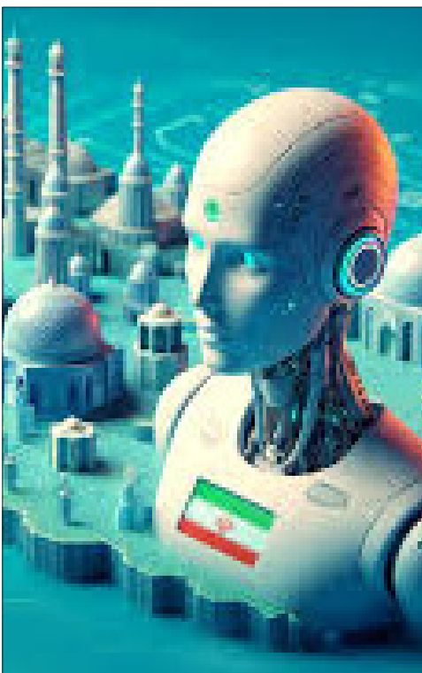
به گفته یک کارشناس هوش مصنوعی